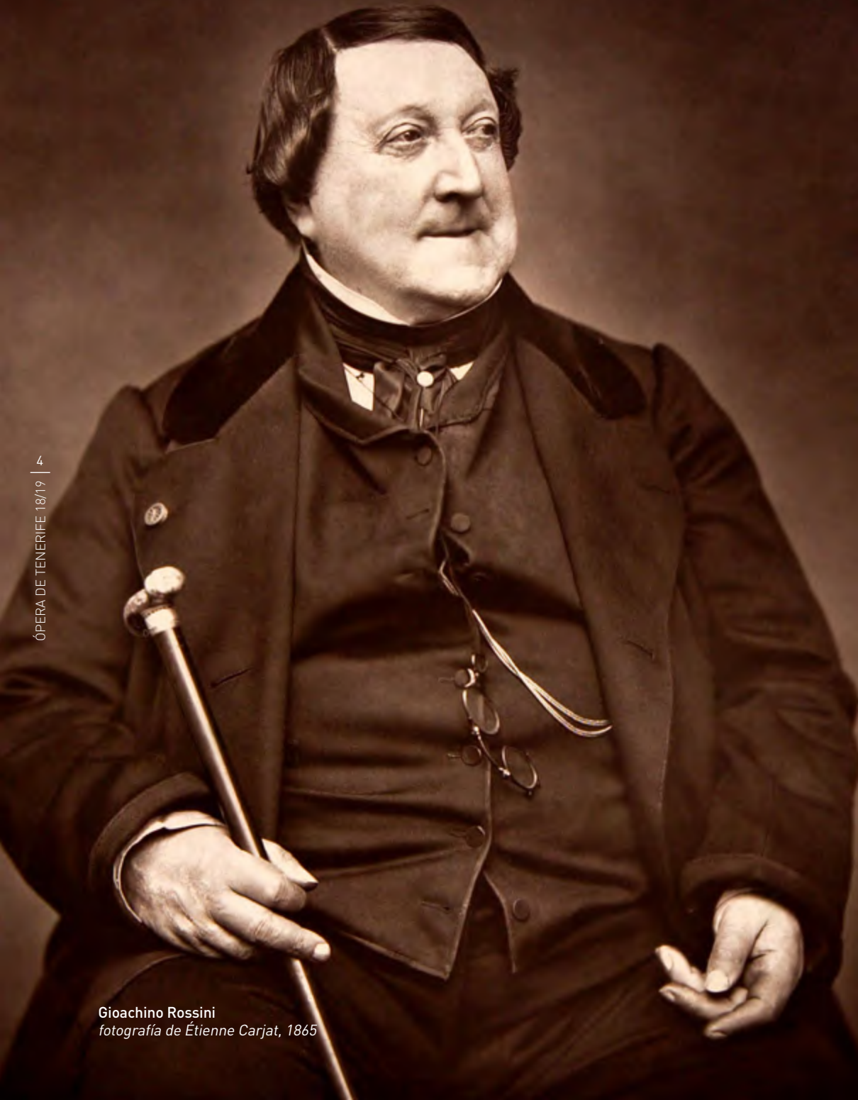
Gioachino Rossini fotografía de Étienne Carjat, 1865